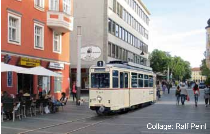
Collage: Ralf Peinl