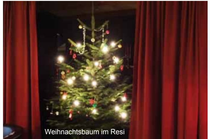
Weihnachtsbaum im Resi

Vor einem schön geschmückten Tannenbaum gabs im Frühstückstreff SOFA in der Blauen-Lilliengasse am 22. Dezember eine kleine feine Weihnachtsfeier. Alle hatten ein Wichtelgeschenk mitgebracht und dazu gabs die BRK-Lebensmittelpakete sowie "bleifreien" Punsch, gestiftet von "Pfannen-Metzger". Nach wie vor wird SOFA ("Sozial & offen für alle") auch jeden Woche vom Backteufel in der Ostengasse unterstützt. Die Mittwochstreffe (10-13Uhr) sind - vergleichbar mit Gaststätten - nach 2G-Regeln möglich, weil alle Sofas geimpft oder genesen sind und es gibt zwischen den Jahren auch keine Pause: Willkommen sind alle, die einsam sind und nette Gesellschaft bei guter Unterhaltung suchen.